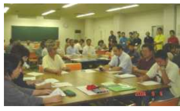
5つのグループにわかれます。