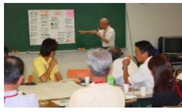
グループで出した意見を分類し、発表します