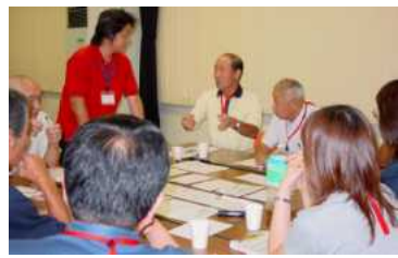
グループの中で意見を出し合います。