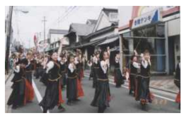
昨年の大道芸まつりの様子

当日は、唐津街道の一部が車両通行止めとなり、お祭りムード一色となります。みんなで赤間地区のお祭りを盛り上げていきましょう。皆様のご来場、お待ちしております。