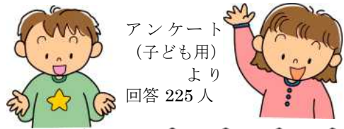
アンケート (子ども用) より 回答 225人