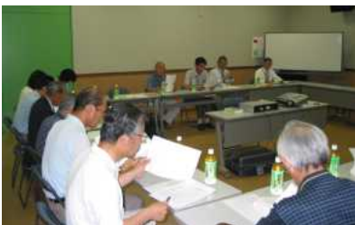
健康福祉部会 視察研修の様子